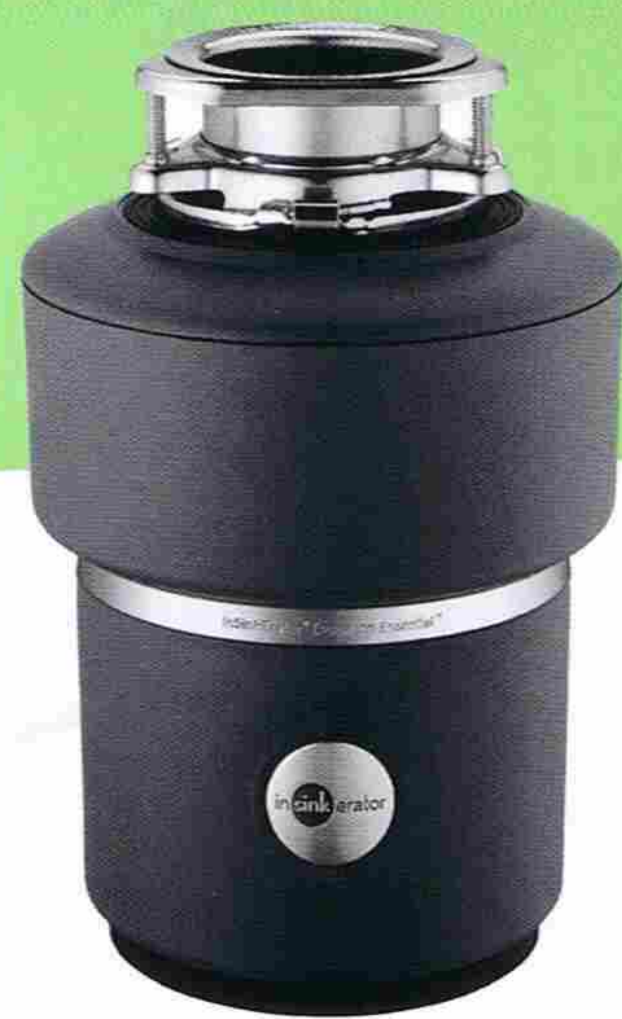
Evolution 的靜音技術比標準處理器安靜 60%。